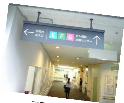
天吊り誘導サイン